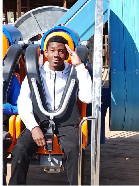
Les 11- 17 en sortie paintball, au parc Spirou et lors d'un tournoi de Mario Kart World.