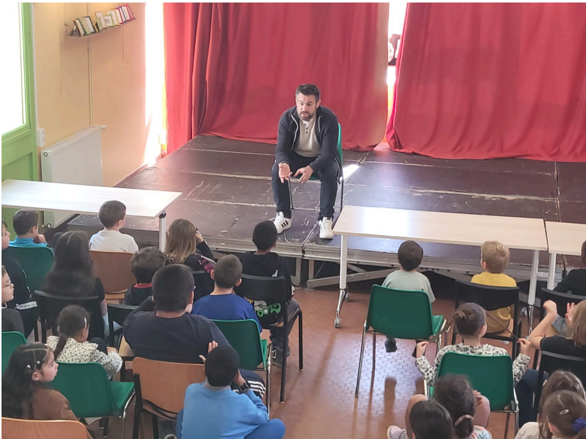
Notre Directeur se prête au jeu en présentant son métier aux 6-11 ans.