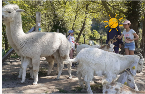
Rencontre des 6-11 ans avec les nombreux animaux du parc Ecozootopia, le 9 avril.